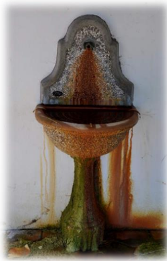
Slika 10: Helena

Na oceni izkušenj drugih vrelic v severovzhodni Sloveniji je mogoče iz teh virov pričakovati izdatnost med 0,5 in 5 l/s. Izjemo predstavlja Cafova slatina, kjer so leta 1973 med poskusnim vrtanjem črpali mineralno vodo s kapaciteto 4 l/s in temperaturo 19°C. Globina vrtine je znašala od 67 do 127 m. Po končanih poskusih se je tudi izdatnost Cafove slatine ustalila pri kapaciteti 0,2 l/s (Možnosti zajemanja termalne vode..., 1997)