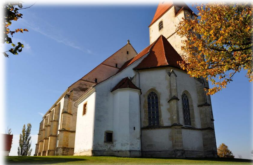
Slika 4: Cerkev svetih treh Kraljev

Cerkev svetih Treh Kraljev stoji na 305 metrov visokem griču in jo je dovolil pozidati salzburški nadškof Matevž Lang pl. Wellenburg leta 1521, kot podružnično romarsko cerkev. V letih med 1521 in 1528 so župljani najprej zgradili enoladijsko cerkev. Plašč današnje cerkve ali vsaj ladje, je bil verjetno dokončan leta 1558. V drugi polovici 16. stoletja je bil pozidan zvonik in obokani obe stranski ladji (prezbiterij je bil obokan šele leta 1564, ladijski prostor pa leta 1577). V naslednjih stoletjih (leta 1756 ali 1757) je bila prizidana zakristija z oratorijem. Med 1902 in 1903 je bila v celoti obnovljena notranjost in zunanost. Poznogotska triladijska cerkev sodi med največje umetnostne spomenike v Sloveniji. Štiri zunanje portale krasijo oporniki ter venčni zidec, ki se nad vrati in pod okni pravokotno lomi. Zvonik je nadstropje višji kot sleme strehe in ima dodan stolpič s stopniščem. Vhod v cerkev z juga, zahoda in severa predstavljajo trije bogato členjeni portali, četrti, v južni steni prezbiterija, je preprostejši. Nad zahodnim portalom je letnica 1558.