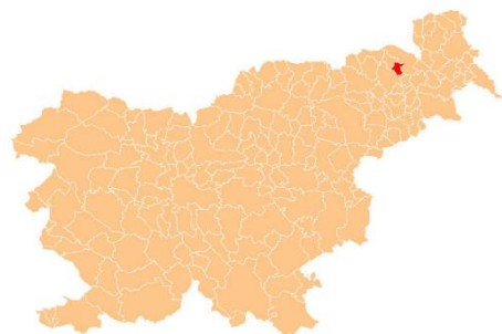
Slika 2: lega

Benedikt z okolico spada med najbogatejša arheološka najdišča v Sloveniji. Ženjak je z najdbo negovskih čelad postal svetovno znan. Gomilna nekropola v Trotkovi spada s svojimi 57 gomilami med največje v Sloveniji. Najlepše ohranjeni fosil mladiča miocenskega kita je bil izkopan blizu Benedikta. Mnoge tukajšnje najdbe omogočajo raziskovanje poselitve tega območja od 2200 pr. n. št. do 1000 n. št.