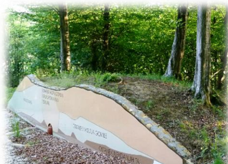
Slika 7: Gomile