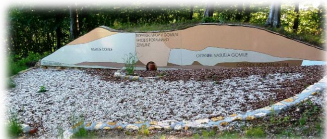
Slika 8: Gomila