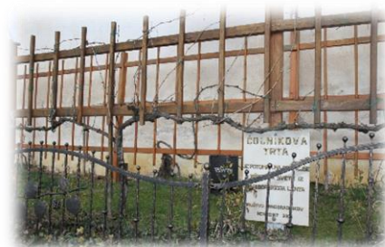
Slika 6: Mežnarija

Mežnarija, ki je nekoč služila kot romarska hiša, stoji v neposredni bližini cerkve Svetih treh kraljev in ima obliko črke L. V podolžnem gotskem delu stavbe so ohranjeni dragoceni kamnoseški detajli in portal. Nastala je sočasno s cerkvijo (1521–1588) in spada med najstarejše zidane kmečke hiše na Slovenskem.