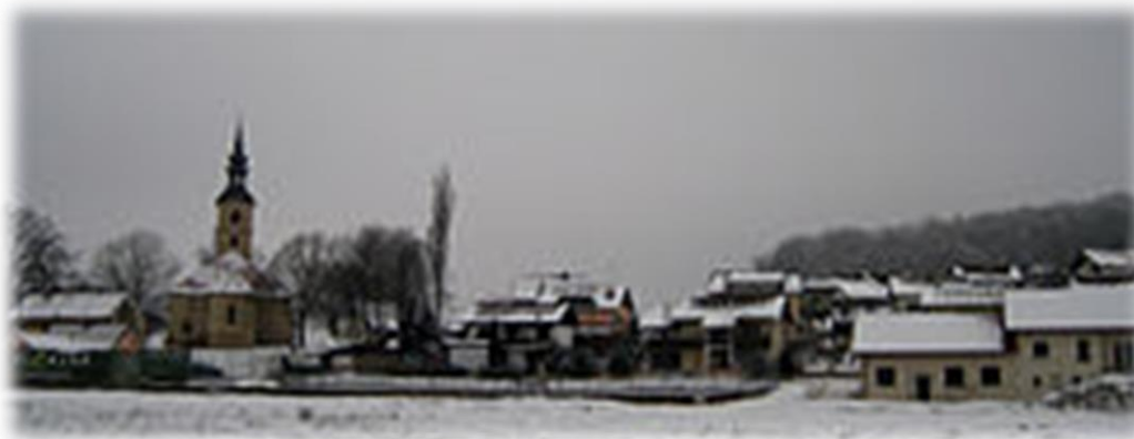
Slika 3: Benedikt pozimi

V vasi raste ene debelejših lip v Sloveniji z obsegom 532 cm (merjeno leta 1982) in z višino 35 m. Ima lepo okroglo razraslo krošnjo.