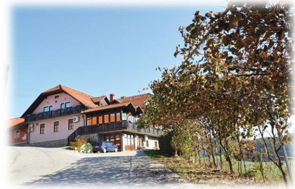
Slika 11:Gostilna Kavčič

Gostilna Kavčič je družinsko podjetje, ki svojim gostom nudi domačo hrano in vzdušje ter mirno, otrokom primerno okolje. Nahajajo se na hribu ne daleč od magistralne ceste Lenart – Gornja Radgona.