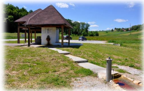
Slika 9: Slatinski vrelci

V Slovenskih goricah Šlebinger omenja izvire mineralne vode v Plitvicah, Spodnjih Ivanjcih, na Policah (kjer naj bi bilo nekdanje celo sedem vrelcev), Spodnji Ščavnici, Ihovi, Stavešincih, Očeslavcih, Okoslavcih, Grabonošu, Negovi, Benediktu v Slovenskih goricah, Negovi, Spodnjih in Zgornjih Žerjavcih in Lormanju. Omenja še obstoj nekaterih manjših vrelcev, vendar pa ne govori o njihovi natančni lokaciji. Kot zanimivost omenja izvir slatine na Stavešinskem Vrhu, ki so ji domačini dali ime Slepica, ker naj bi oslepila ptiča, ki leti čez izvir (Šlebinger, 1932).