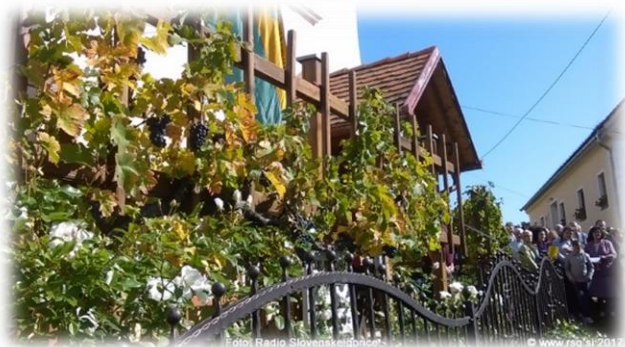
Slika 5: Čolnikova trta