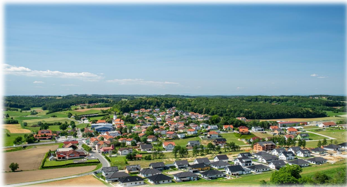
Slika 1: Benedikt